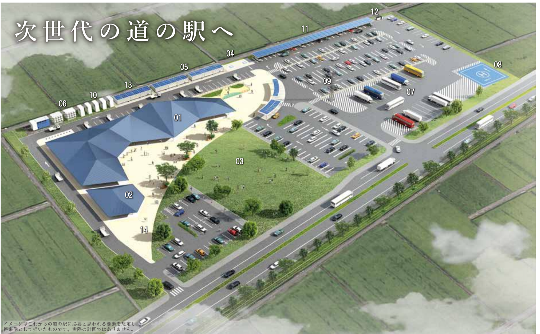
イメージはこれからの道の駅に必要と思われる要素を想定し、将来像として描いたものです。実際の計画ではありません。