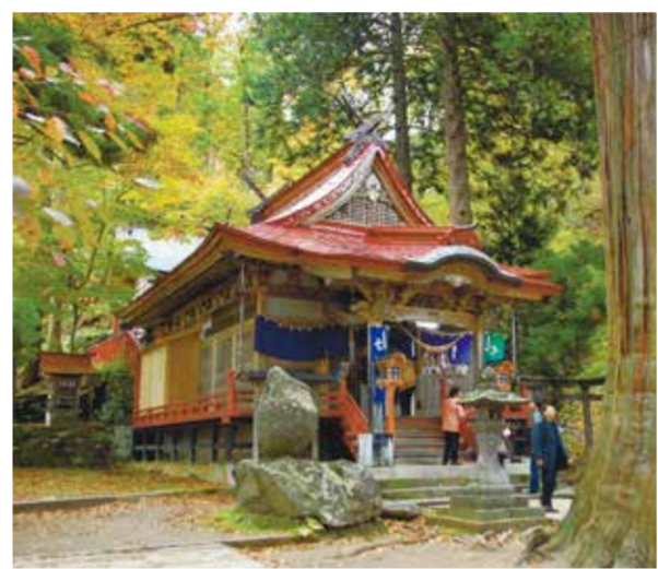
杉の巨木に囲まれた中野神社