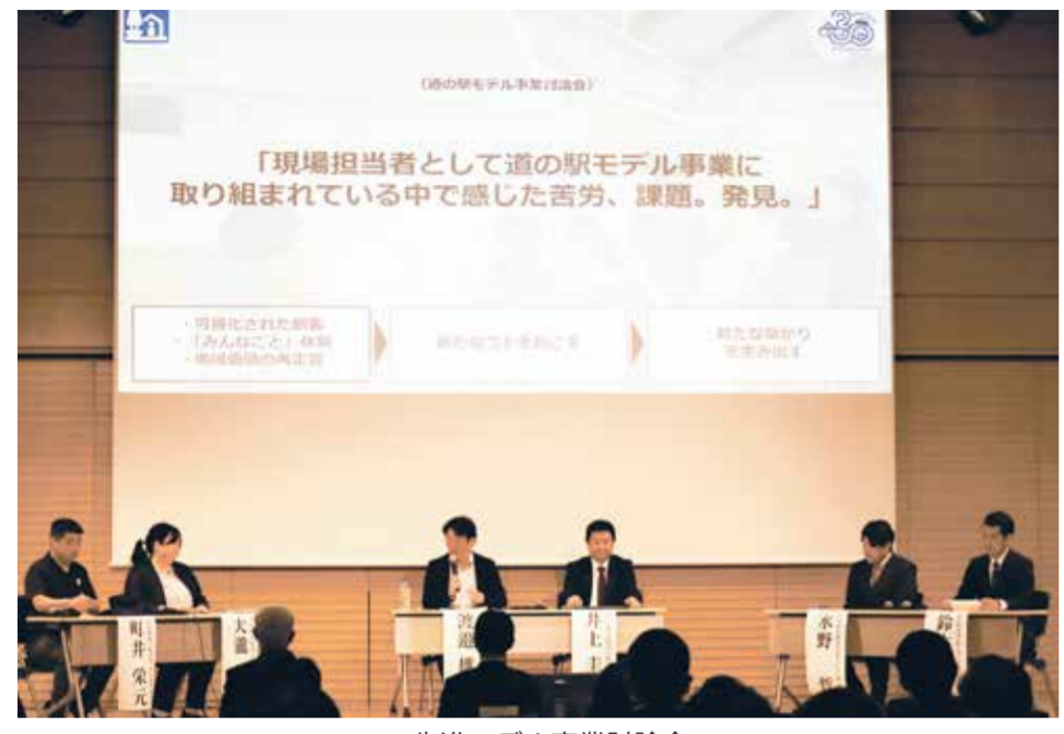
先進モデル事業討論会