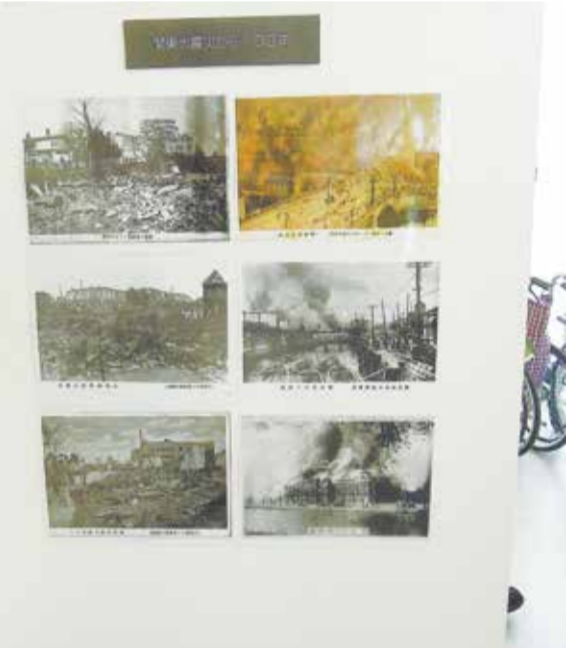
関東大震災の生々しい写真も展示

UR(都市再生機構)の関係会社、関西都市居住サービスも1月中旬～3月下旬にかけて、道の駅ではないが関西の関連施設5カ所(神戸市、大府富田林市・和泉市、奈良県大田町・香芝市、兵庫県西宮市)で、同様の内容の企画展「過去に学び、未来に備える、災害と対策展」を開催した。 昨年同時期に続く2回目の企画展で、阪神淡路大震災の関連写真も展示され、来場者に身近な災害の恐ろしさを訴え、防災・減災への備えを促した。