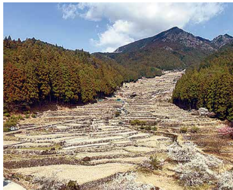
四谷の千枚田(愛知県新城市)

食料生産、国土保全、水源涵養など、多様な機能を含む「棚田」は、先人たちが土に働きかけを続けてきた歴史のたまものです。私たちが暮らす愛知県東三河地域にも素晴らしい棚田遺産が遺されています。今回は、棚田地域振興のお話です。