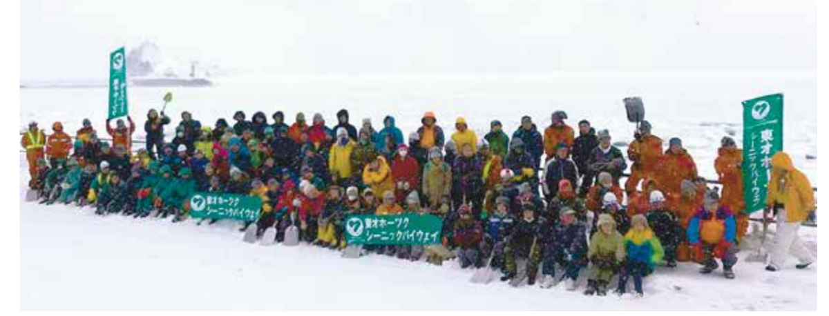
ガードレールの雪かきに参加した仲間たち

長い年月にわたつて安定した収入が前提となる「結婚して子供を持つこと」に踏み切れないのです。にもかかわらず、直近の22年のデータでも、正規雇用が前年比12万人も減つて、非正規雇用が13万人も増えていた。これで少子化の解決策は、子ども手当アップだとか出産費用支援などだけではないことがわかります。異次元の対策というのなら、もっと問題の本質に切り込んでほしいのですね。