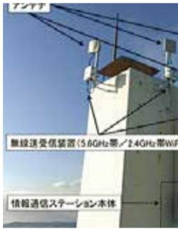
非常時にも通信手段が確保できる通信インフラの設置例