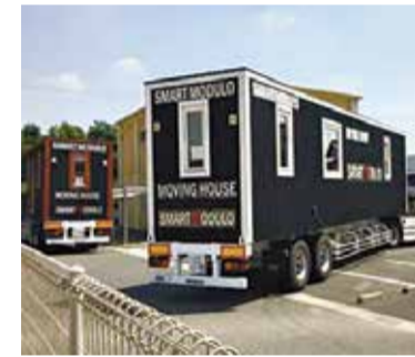
施設パッケージの組み合わせの骨格を担う移動可能なムービングハウス