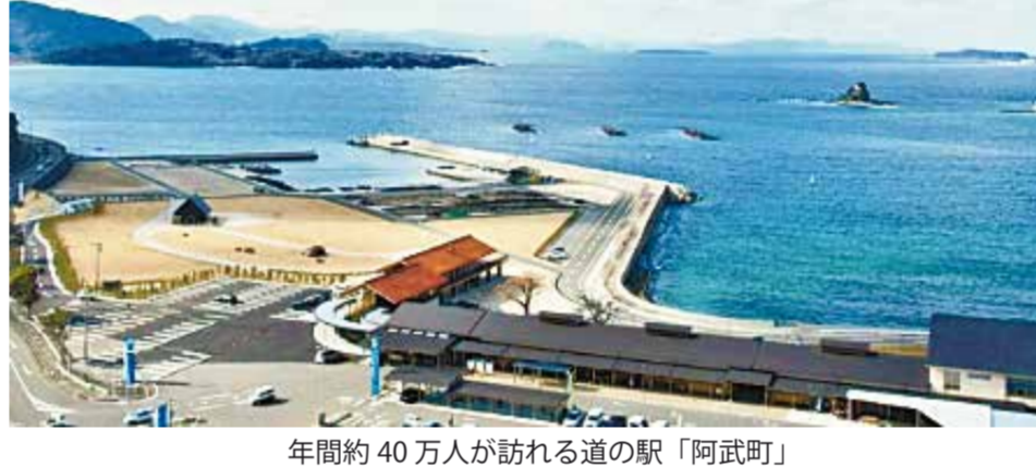
年間約40万人が訪れる道の駅「阿武町」