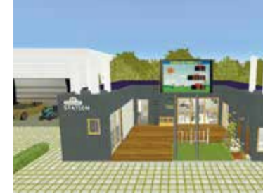
防災に必要な設備を組み合わせ、平時時・非常時に切り替え可能な施設パッケージのイメージ