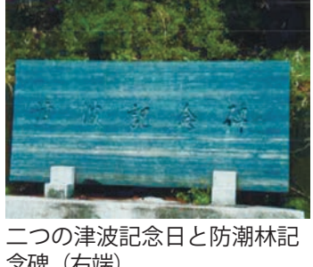
二つの津波記念日と防潮林記念碑 (右端)

録は18回に及び特に明治29年、昭和8年は死者総数538人、負傷者267人、家屋流失185戸を数え想起するに慄然たるものがある。われわれは殉難者の霊を慰めると共に宿命的な惨事を再び繰り返さぬことを祈念してやまない」と記す。