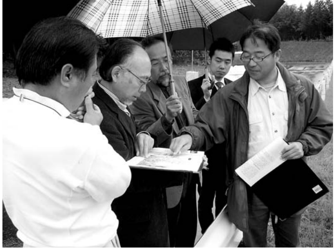
湖水ルートで登録へ向けた景観調査

実は、この風景街道に「中は神仏霊場巡拝路のほか海八景」のような絶景以外にも一つ延長約1000mの「湖水ルート」が設定されている。穴道湖、中海、演出が沿いを、少し小さい「8」字状に巡るルートだ。