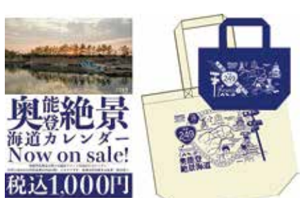
絶景カレンダーとバッグ

道「能生」(糸魚川市)、「うみてらす名立」(上越市)と連携、特産品直売などのイベントを開催。両駅と世界ジオパークに指定されている浜徳を走らせている。