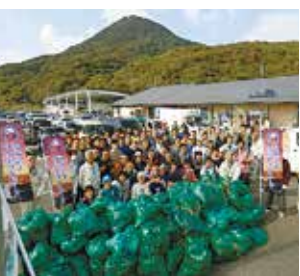
「させぼつくす99」内に大量に集められたごみ