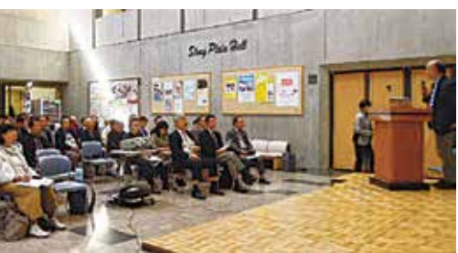
道の駅で風景街道セミナー＝北海道「しかおい」で

ロコマークはコシノジュンコさんが手がけ、日本の象徴富士山をモチーフに、歴史や文化が道路を介して未来へと続いていくことへの願いをこめて表現した。